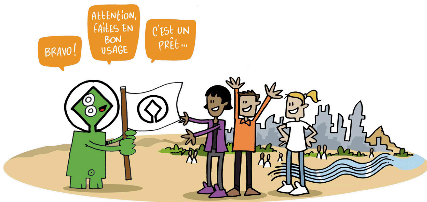
Illustration extraite du Petit illustré du patrimoine mondial © Olivier Sampson /ABFPM

Un Bien n'est d'ailleurs jamais inscrit de manière définitive. Il peut être placé sur la Liste du patrimoine en péril, ou être retiré du patrimoine mondial si sa valeur universelle et exceptionnelle a disparu sous l'effet d'action humaine ou de catastrophe naturelle. L'effort des États signataires doit être permanent et constamment guider les réflexions d'évolution.