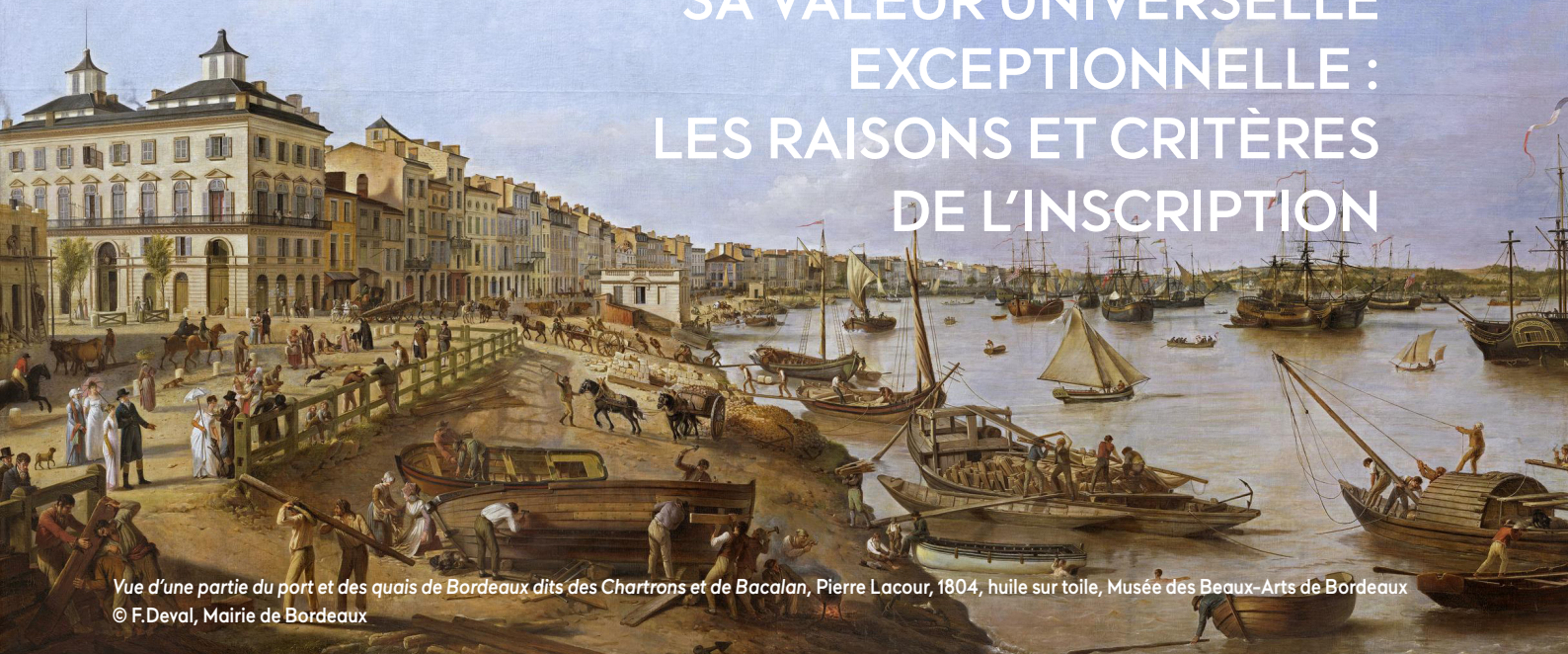
Vue d'une partie du port et des quais de Bordeaux dits des Chartrons et de Bacalan, Pierre Lacour, 1804, huile sur toile, Musée des Beaux-Arts de Bordeaux

La déclaration de valeur universelle et exceptionnelle établie au moment de l'inscription précise en quoi Bordeaux, port de la Lune répond à deux critères en particulier.