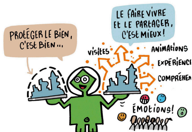
Illustration extraite du Petit illustré du patrimoine mondial

Tout l'enjeu est de le faire vivre, le partager et faire en sorte que son évolution s'effectue en respectant la valeur universelle exceptionnelle du Bien.